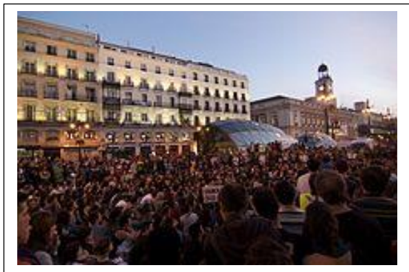
Manifestation à Madrid sur la place Puerta del Sol , le 15 mai.

L'indignation devant la corruption touchant les couches dirigeantes, la colère suscitée par des politiques de régression sociale (expulsion des logements, IVG, Libertés Publiques), et d'austérité s'avérant désastreuses pour la société civile, l'envie de retrouver un espoir pour la jeunesse et la soif de démocratie sont les ressorts de la mobilisation du « peuple » espagnol face à la « caste ».